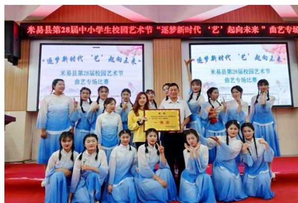
图5-5 校园艺术节红色文艺汇演《觉醒年代》荣获第一名

学校在传承红色基因文化方面所取得的成效得到了社会各界的广泛认可和好评。学校的社会影响力不断扩大，成为了传承红色基因文化的重要阵地。