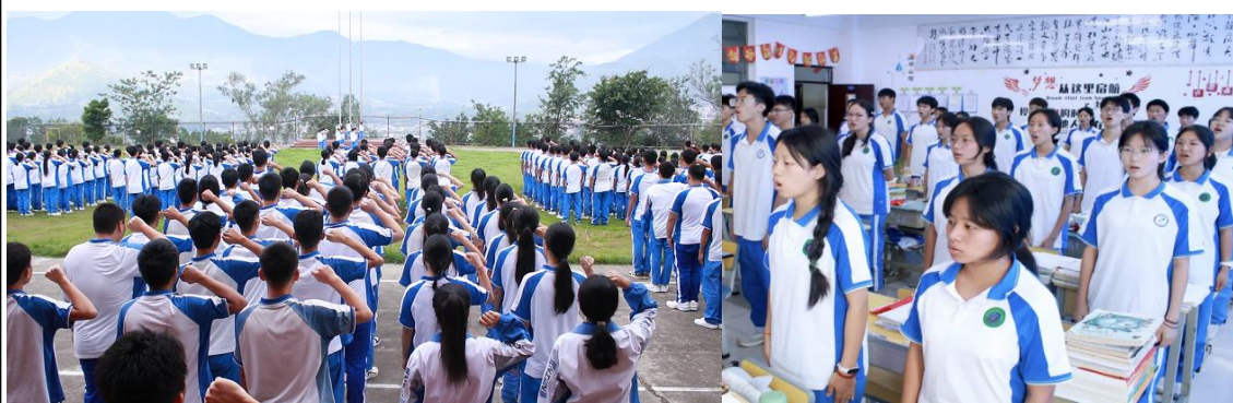
图2-2 每天面对国旗宣誓

为了提升学生的精气神，在这个过程中再把爱国教育融入进去，感受祖国的强大，学习老一辈的革命精神。