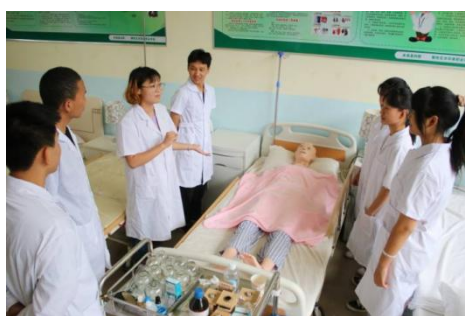
图2-12 病房护理岗位模拟