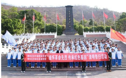
图5-2 “缅怀先烈 传承红色基因”清明祭扫活动