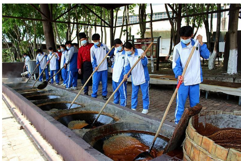
图5-1 校企工匠进校园

邀请企业工匠进校园： 邀请企业中的技术能手和工匠大师走进校园，为学生举办讲座、开展技能示范和指导。工匠大师们分享自己的成长历程和工作经验，传授专业技能和职业心得，用他们的亲身经历和实际行动诠释工匠精神的真谛。学生们与工匠大师面对面交流互动，近距离感受工匠的魅力和风采，受到极大的鼓舞和启发。