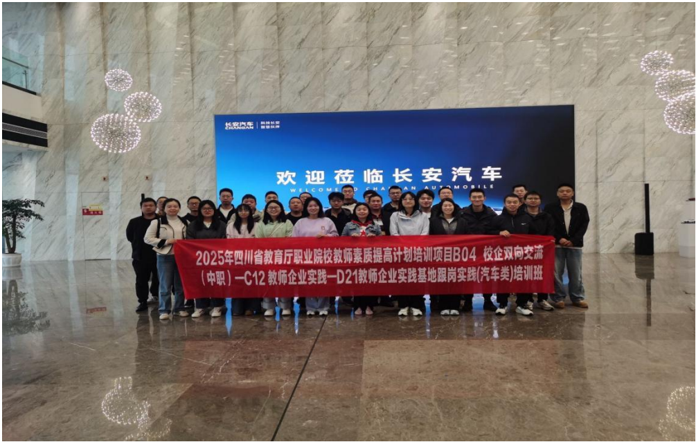
图1-3 教师参加国培计划企业实践

企业实践锻炼： 落实教师企业实践制度，组织4名专任教师赴合作企业（米易华森糖业有限责任公司、米易华盛机械有限责任公司）顶岗实践、参与项目研发，累计实践时长90天，教师实践教学能力显著提升。