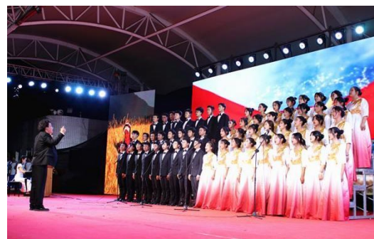
图 5-3 “红色校园文化节合唱《我和我的祖国》”